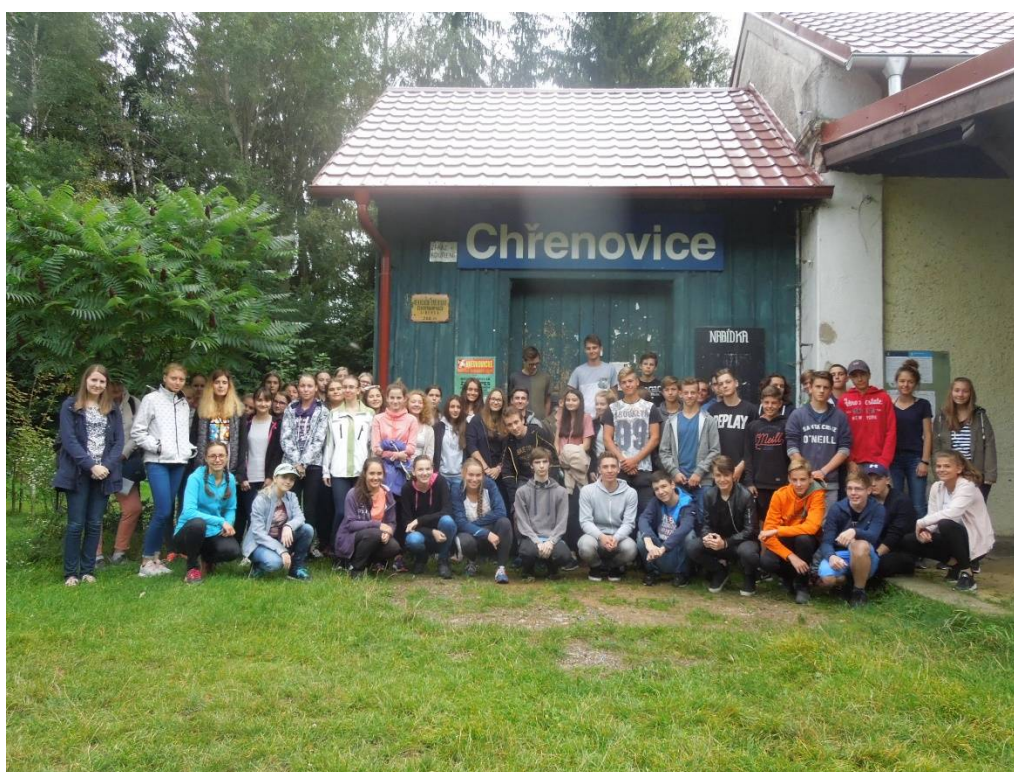
1.C a 1.D na adaptačním kurzu