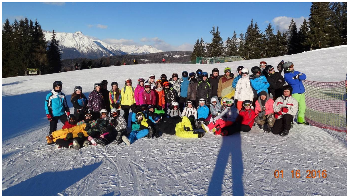
4. B a 4.D na lyžařském kurzu